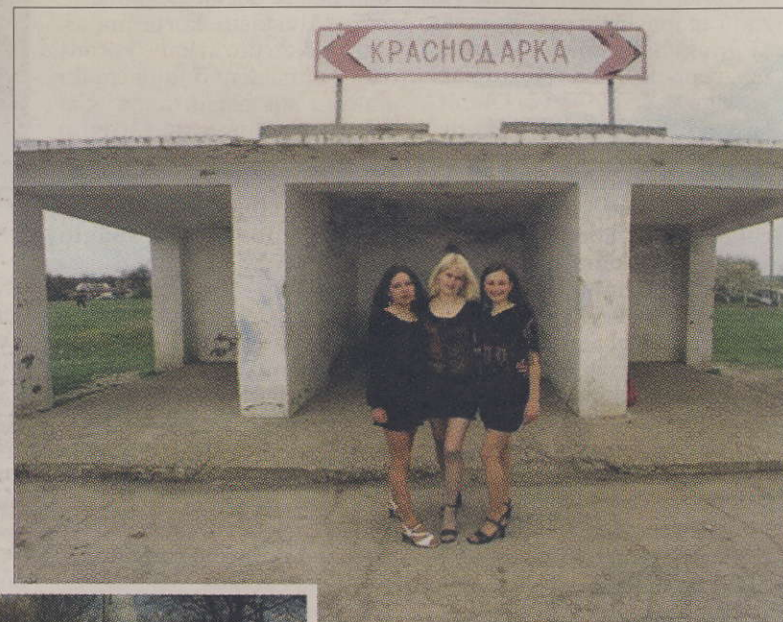
Krasnodarka tüdrukud koduküla taustal pillava luksusena tunduvates koolilõpukleitides.